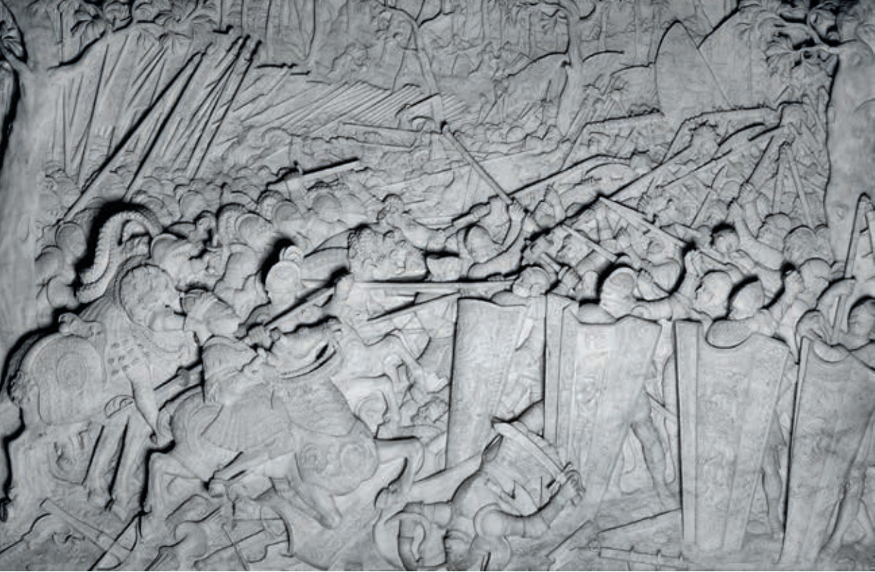
Marmorrelief am Sarkophag Maximilian I., Die Schlacht bei Regensburg 1504

ersten großen Sieg errang. Beraten durch erfahrene burgundische Feldherren bediente er sich – unterstützt durch Feldartillerie und Reiterei – einer vorrückenden Wagenburg mit lanzenstarrendem Fußvolk als rollender Festung; eine Taktik, die bereits die böhmischen Hussiten angewandt hatten und die der junge Erzherzog aus Österreich mitgebracht hatte.