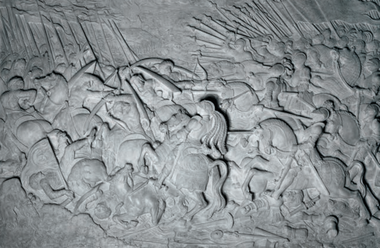
Marmorrelief am Sarkophag Maximilian I., Der Türkenkrieg in Kroatien 1493