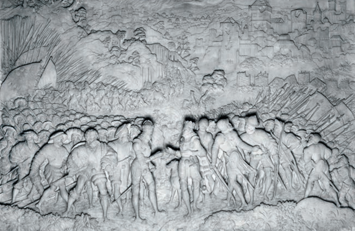
Marmorrelief am Sarkophag Maximilian I., Die Eroberung von Tournai 1513

besondere das Reich trug kaum finanziell wie militärisch zu den Unternehmungen Maximilians bei, während die Erblande die Hauptlast schultern mussten. Den Hauptgegnern Frankreich und Venedig war er daher in materieller Hinsicht meist unterlegen.