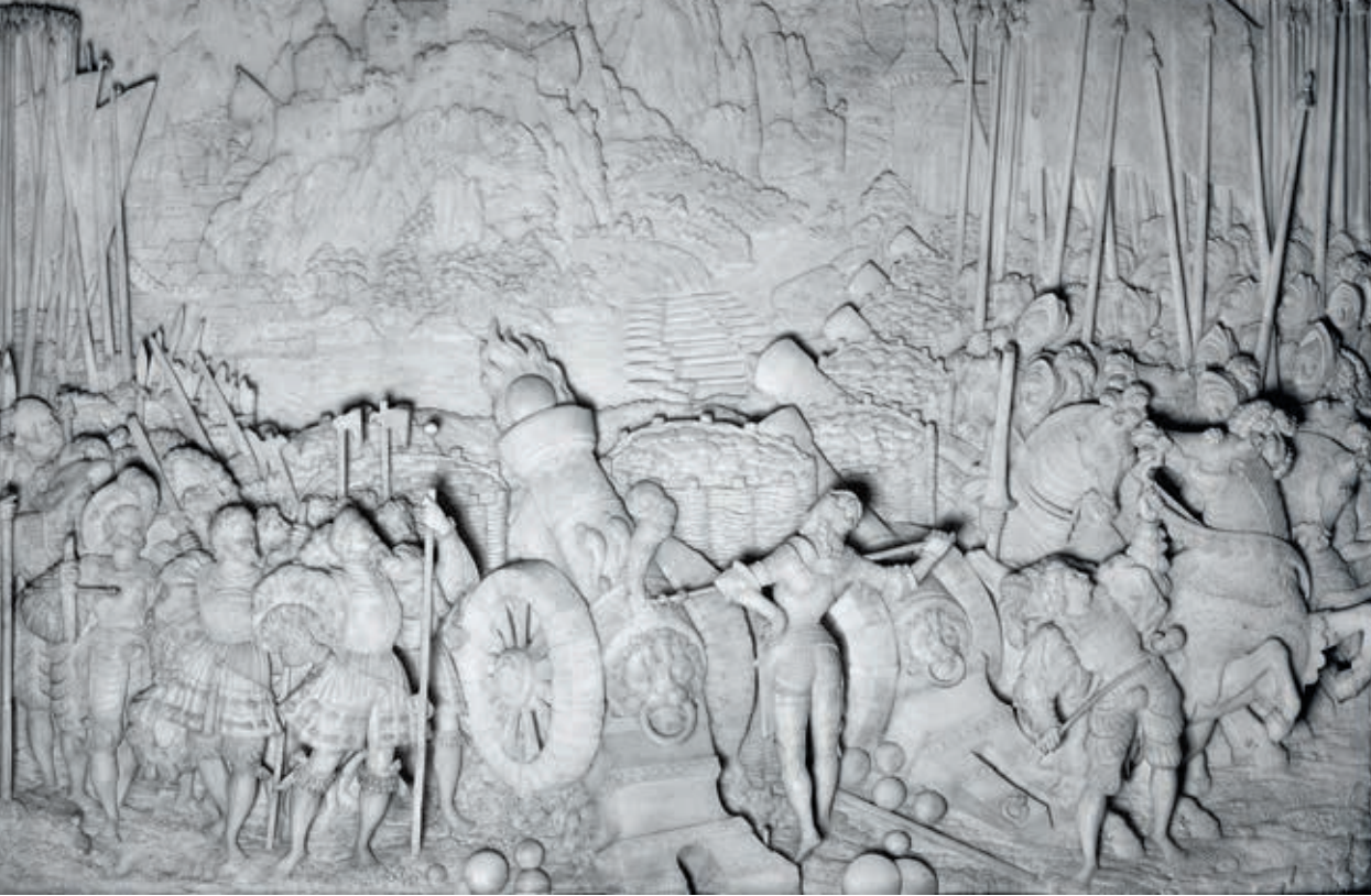
Marmorrelief am Sarkophag Maximilian I., Die Eroberung von Kufstein 1504

sischen als eine der modernsten und effizientesten im damaligen Europa. Maximilian kopierte deren Reiterarmee, die sogenannten Ordonnanztruppen, und stellte solche auch in den Erblanden auf. Diese Einheiten agierten in der Folge im Verband mit den Fußtruppen und der Artillerie; dabei kam den Panzerreitern die Aufgabe zu, Breschen in die gegnerischen Reihe zu schlagen bzw. diese zu sprengen, um das Vordringen der Infanterie zu ermöglichen. Obwohl noch durchaus mittelalterlichen Traditionen verbunden, verzichtete Maximilian im Heerwesen bewusst auf den klassischen Ritter in seiner Rüstung. Er erkannte, dass diese Art der Kriegsführung mit dem ritterlichen Einzelkampf im Gefecht endgültig vorbei war.