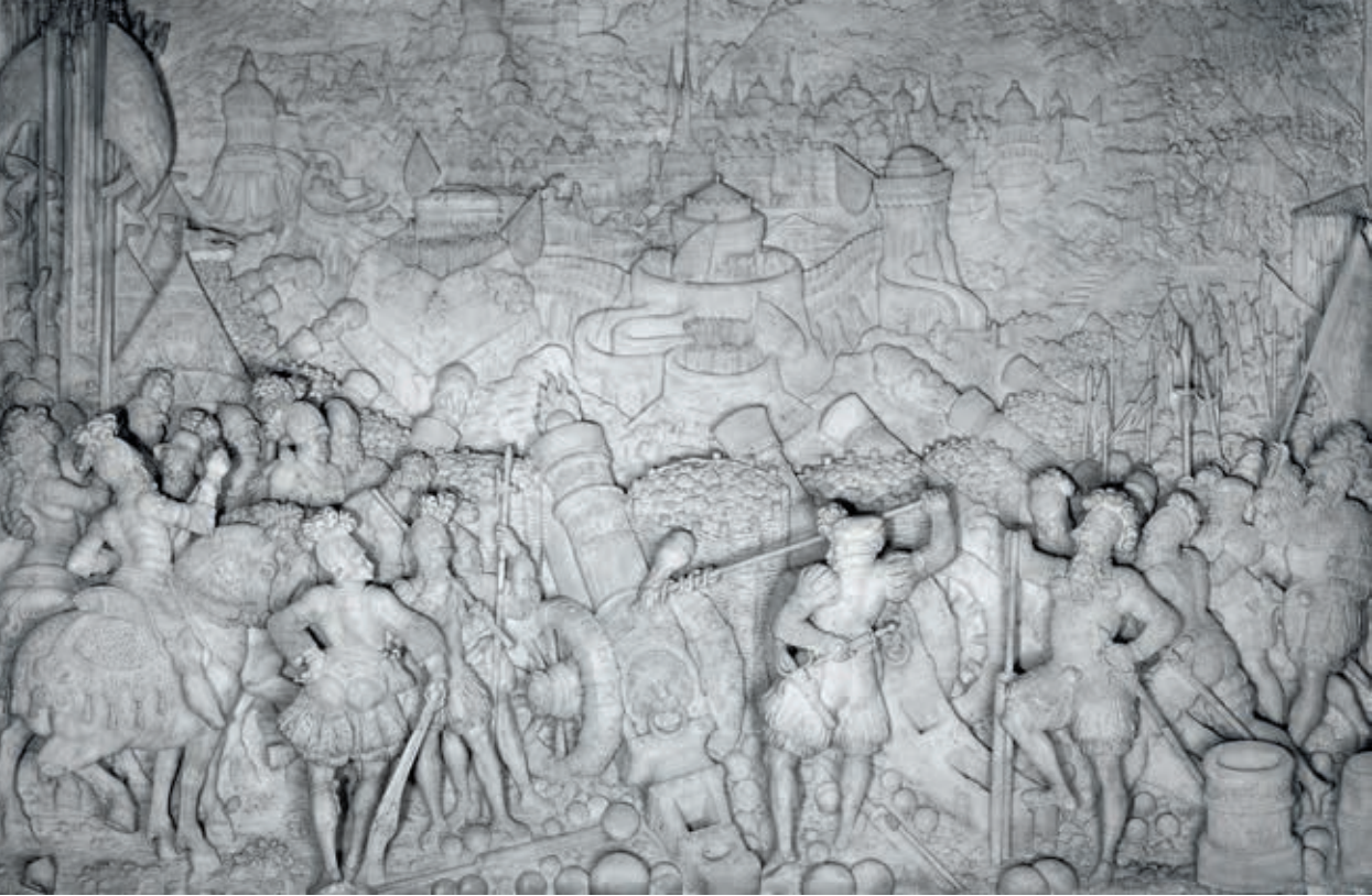
Marmorrelief am Sarkophag Maximilian I., Die Verteidigung von Verona 1516

als ihn seine nicht entlohnten Landsknechte umringten, niederbrüllten und bedrohten. Die Auseinandersetzung begann mit einer eigentlich irrationalen Entscheidung: Maximilian wollte die ihm durch die Venezianer zugefügte Schmach (Verweigerung des Durchzugs) nicht auf sich sitzen lassen und ließ sich zu einem völlig aussichtslosen Angriff gegen die Lagunenrepublik im Cadore hinreißen.