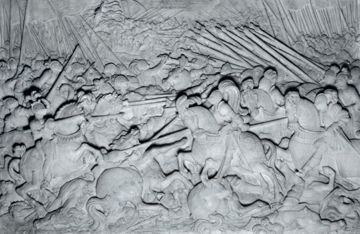
Marmorrelief am Sarkophag Maximilian I., Die zweite Schlacht bei Guinegate 1513

wären. Dies trifft sicherlich in Bezug auf die Behauptung des burgundisches Erbes zu; hinsichtlich der Wahrung der Ansprüche seines Hauses bzw. des Reiches ist dies differenzierter zu sehen. Maximilians Versuche, die Reichsrechte in Italien unter Rückgriff auf karolingische und staufische Traditionen wieder herzustellen, mögen aus seiner Sicht legitim und berechtigt gewesen sein, die politische Realität an der Wende vom 15. zum 16. Jahrhundert war jedoch schon längst eine andere. Dies zu erkennen und in der Folge seine Strategie danach auszurichten, tat sich der Kaiser schwer. Die verschiedenen Mächte auf der Apenninhalbinsel, das Papsttum, Venedig, Mailand, Florenz und Aragon-Sizilien, wollten weder eine kaiserlich-habsburgische noch eine französische Bevormundung, sondern